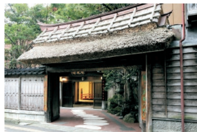
国登録有形文化財の北門

江戸時代、城下町高田から生まれた多彩な名産品、そして文化的な名所や、海の幸・山の幸が豊かなまち 上越市。