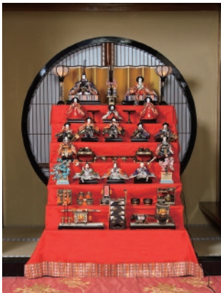
百年料亭 宇喜世のひなめぐり

※「使っ得! にいがた県民割キャンペーン」は、新潟県にお住まいの方のみご利用可能で、ワクチンを接種済であること、またはPCR検査等の検査結果が陰性であることの証明書提示が必要となります。※詳細内容は、ご旅行条件(裏面)をご確認ください。 (新型コロナウイルス感染症の感染拡大のおそれがあると県が判断した場合には、当該キャンペーンの予約・利用を停止します)