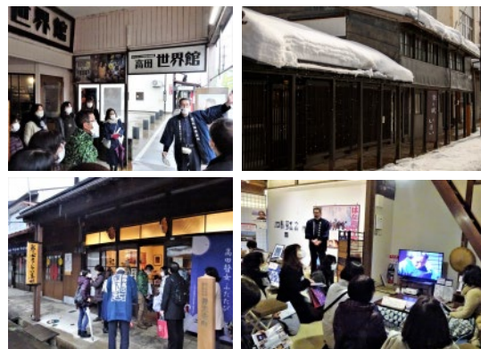
写真/左は替女さんイメージ。上真中は高田世界館、上右は雪が積もった旧今井染物屋の雁木、 下真中、右は替女ミュージアム高田。